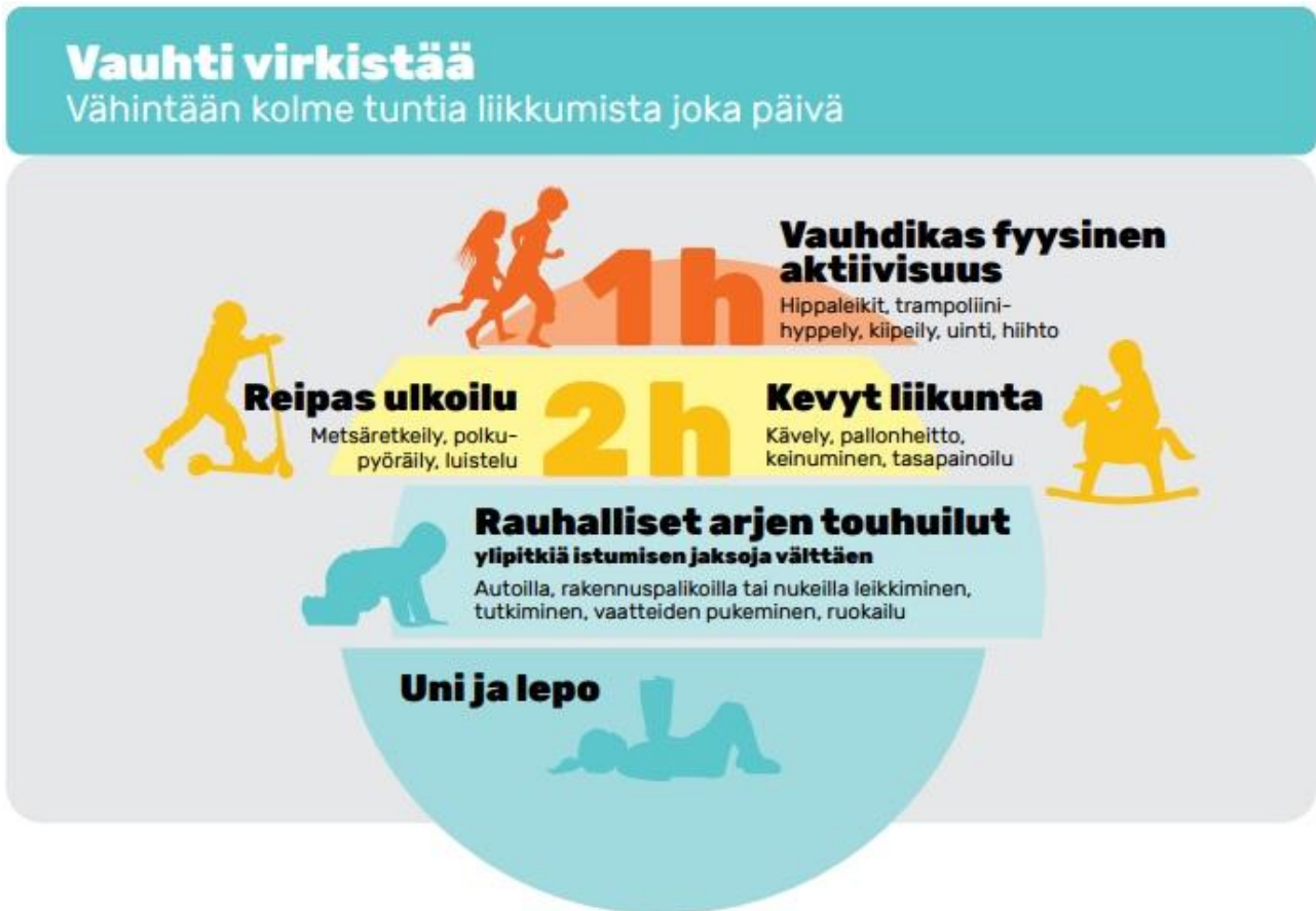
Kuva 1: Suositeltava fyysinen aktiivisuus koostuu päivän mittaan kuormittavuudeltaan erilaisista arjen touhuista. (OKM 2016)

Ohjattujen liikuntatuokioiden lisäksi henkilöstön tehtävänä on luoda oppimisympäristö ja toiminta liikumisen mahdollistavaksi ja siihen houkuttelevaksi. Lapsilla tulee olla riittävästi ulkoilua ja liikkumiseen houkuttelevia tiloja ja välineitä. Päiväkodin sääntöjä tulee tarkastella turvallisuuden, mutta myös liikkumisen mahdollistamisen ja sen estämisen näkökulmasta. Huoltajien kanssa tehtävä yhteistyö on tärkeä osa liikuntakasvatusta. Varhaiskasvatuskeskusteluissa pohditaan huoltajien kanssa perheen liikuntatottumuksia ja varhaiskasvatuksessa järjestetään perheille liikunnallisia tapahtumia. Monipuolisen toiminnan avulla lasten ja perheiden on mahdollista löytää kullekin sopiva ja mieleinen tapa harrastaa liikuntaa.